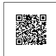
Zažádejte o vytyčení